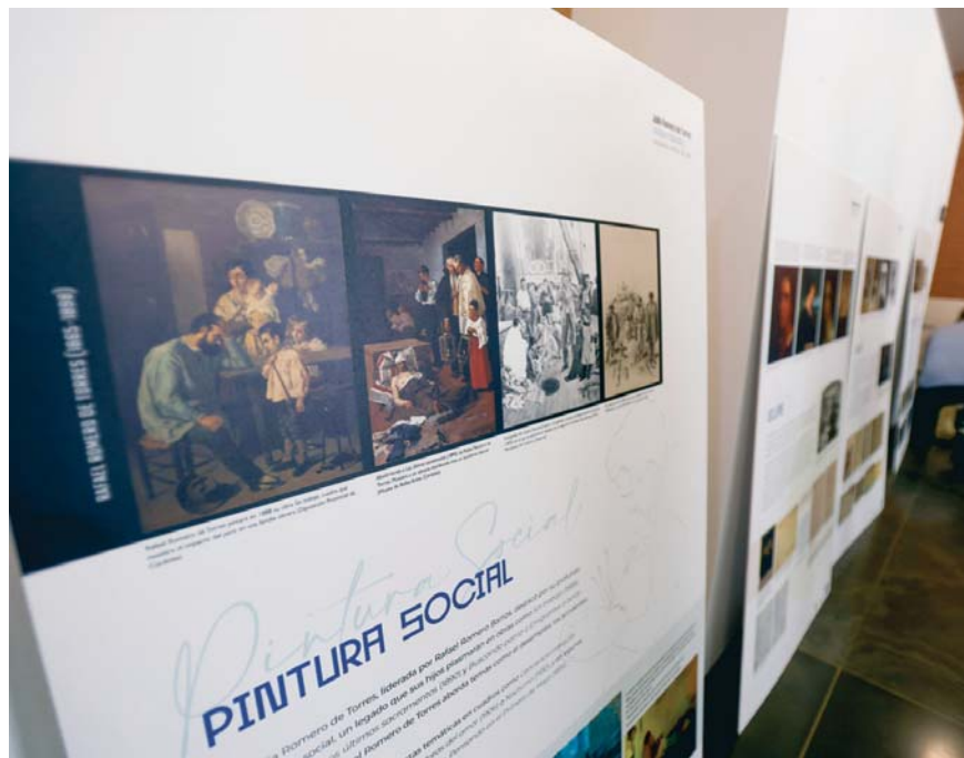
Documentos, fotografías, recortes de prensa e ilustraciones recrean la época del pintor Julio Romero de Torres.