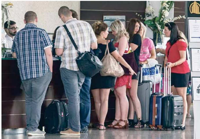
Un grupo de turistas durante su registro en la recepción de un hotel.

Los hoteleros también tienen dificultades para que los