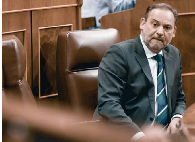
El exministro José Luis Ábalos en el Congreso de los Diputados.

Sin embargo, aclara el juez, la Audiencia Nacional deberá continuar con la investigación respecto a todos los demás imputados -que llegaron a sumar en torno a una veintena-, y también respecto a hechos atribuidos a De Aldama y Koldo García que no guarden relación con Ábalos, como presuntos delitos contra la Hacienda Pública y/o de blan-