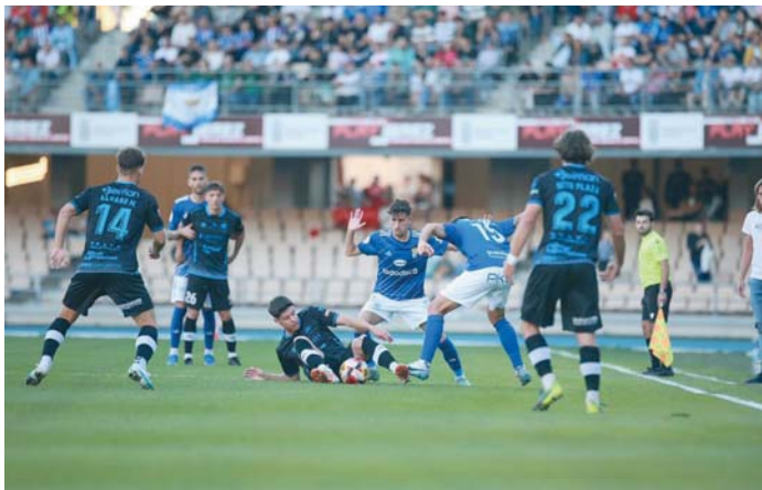
Imagen del partido del año pasado en Chapín, con el Xerez CD ejerciendo de local.

Antes, el Xerez CD tiene otro compromiso en casa. Los xerrecistas reciben al Villanovense el próximo domingo a las 12.00 horas en Chapín. Otro enfrentamiento contra un rival de la zona de abajo de la