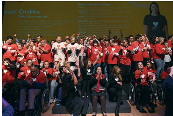
Celebración del Día de las Personas con Discapacidad en los Museos de la Atalaya. VIVA

SOCIEDAD Celebración del Día de las Personas con Discapacidad