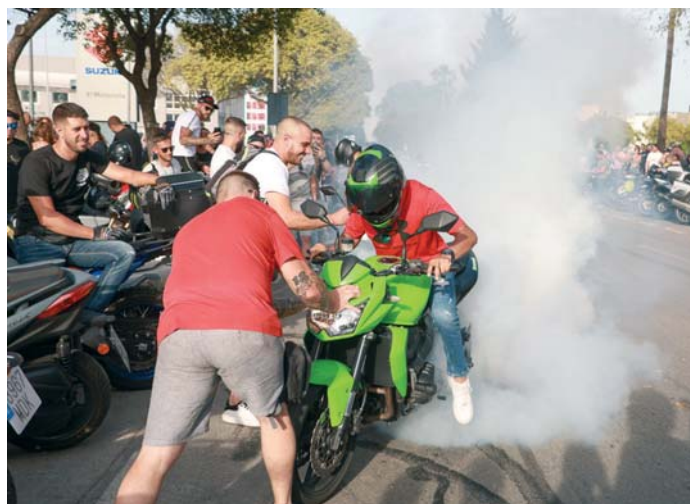
Un motero quemando freno en la Avenida de Europa durante la pasada motorada.

Con este proyecto de ordenanza, el Gobierno local introduce nuevos procedimientos dirigidos a controlar el funcionamiento de actividades susceptibles de producir contaminación acústica, de cara a dar prioridad a la intervención municipal mediante actuaciones dirigidas a prevenir y, en su caso, adoptar medidas correctoras y/o paliativas, dando la oportunidad al desarrollo de las actividades de forma adecuada y hacer posible su