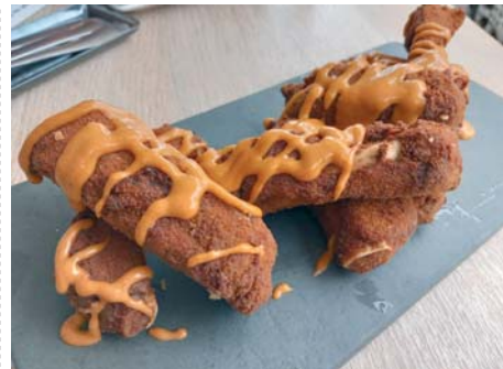
VALDEPEPE. Calle Paraíso, 3. Jerez.

Junto a las alitas de pollo, las costillas son de lo más adictivo de Valdepepe.