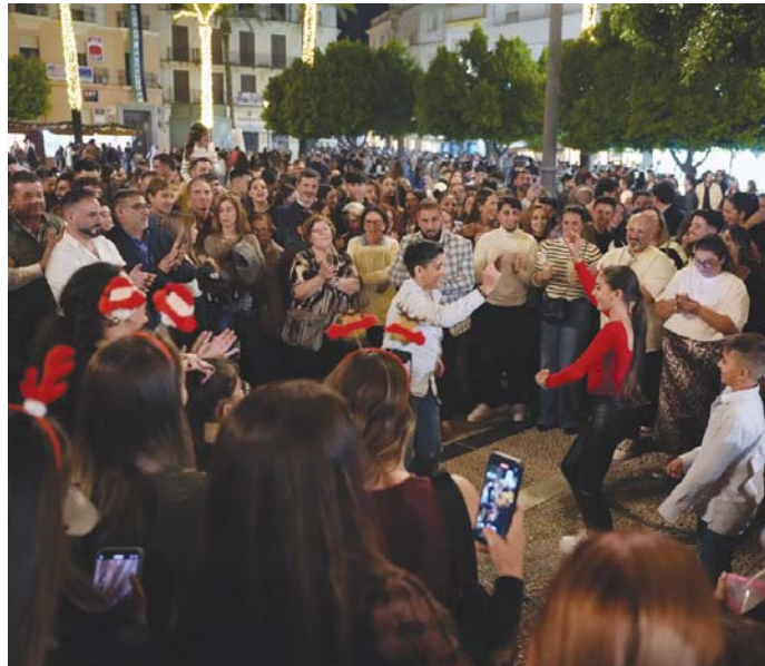
Una imagen de la céntrica plaza del Arenal, en la noche de este pasado sábado. DAVID MARTÍNEZ

Hasta ahora, el presidente del Clúster se ha percatado de que "las plazas en las que se celebran las zambombas se limpian perfectamente", pero