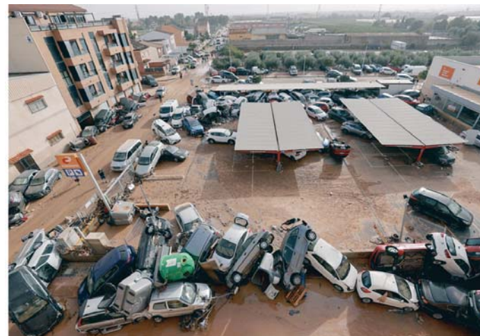
Vista general de vehículos dañados en Paiporta, tras las lluvias causadas por la DANA.

Más de 22.000 transportistas se han visto afectados por el cierre de los principales ejes