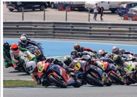
Imagen del ESBK en el Circuito de Jerez.