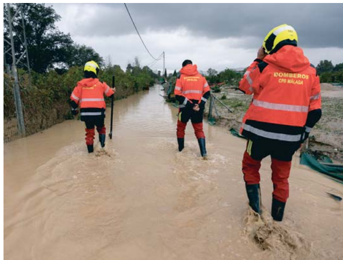
Un grupo de bomberos inspeccionan la barrida de Doña Ana en Cártama en Málaga.

Por su parte, el presidente andaluz, Juanma Moreno, volvió a pedir a los ciudadanos que tengan precaución porque la comunidad mantiene avisos por lluvias intensas. "Evitemos desplazamientos innecesarios y mucho cuidado con la crecida del cauce de los ríos en