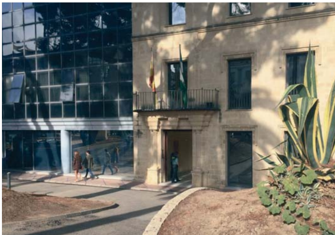
Los hechos se juzgaron inicialmente en la sede de la Audiencia Provincial con sede en Jerez. VIVA

Según la sentencia confirmada por el TSJA, la menor "no era consciente al principio de lo que ocurría" y no contó lo ocurrido "por miedo y vergüenza", y dado que el abusador era la pareja de su madre, el cual además se re-