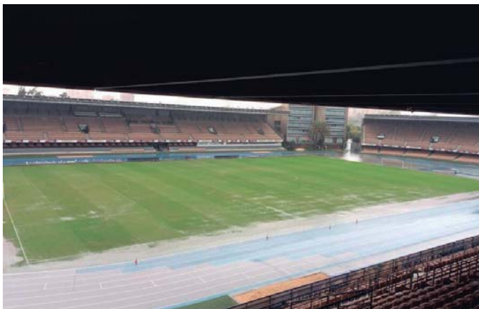
Estado del Estadio Municipal de Chapín tras las lluvias caídas este miércoles.

El Ayuntamiento había hecho público que "ante la prealerta nivel rojo por lluvias pedimos a la ciudadanía que permanezcan en sus domicilios y no salgan a la calle salvo para cuestiones estrictamente necesarias". Una escenario que hacía muy complicado la disputa de un partido de fútbol. De hecho, muchas han sido las imágenes que se han movido en las últimas horas del Estadio Municipal de Chapín con partes del terreno de juego totalmente anegadas.