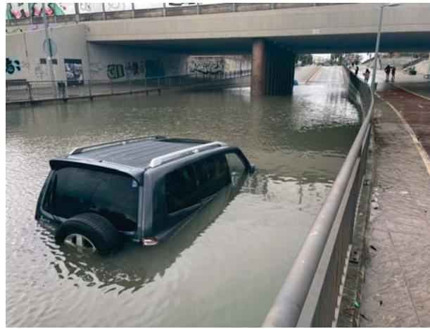
Los bajos de los puentes se convirtieron en uno de los 'puntos negros'. VIVA JEREZ

Coincidiendo prácticamente con el final de la gran tromba de agua que anegó