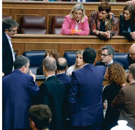
El Congreso reúne a los portavoces para suspender el pleno.