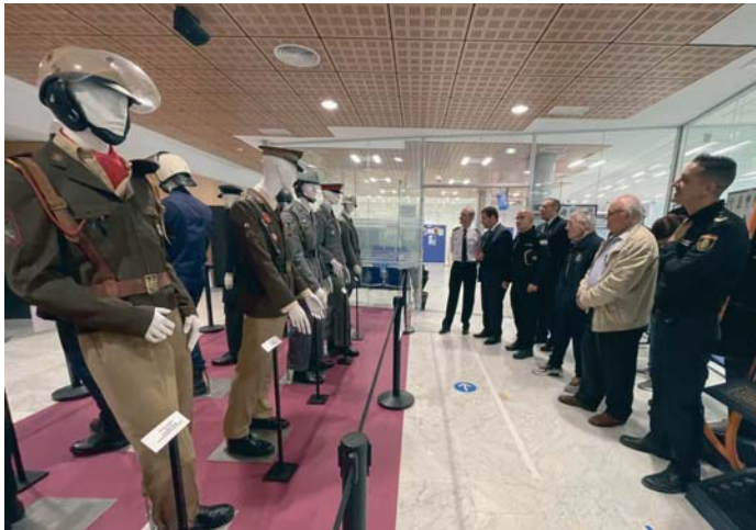
Momento de la inauguración de la exposición en el hall de entrada a la Comisaría de Jerez.

La Policía Nacional, como servicio público, refleja en