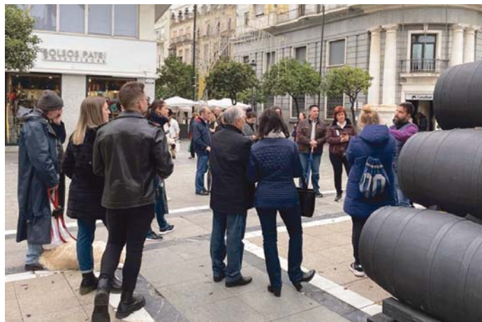
Un grupo de turistas sigue las explicaciones de su guía en la plaza del Arenal.

La caída de las pernoctaciones fue bastante más moderada -del 1,32%- contabilizándose 64.443, apenas 868 menos que en el mismo periodo del año pasado. Los viajeros españoles sumaron 395 alojamientos más que entonces, por lo