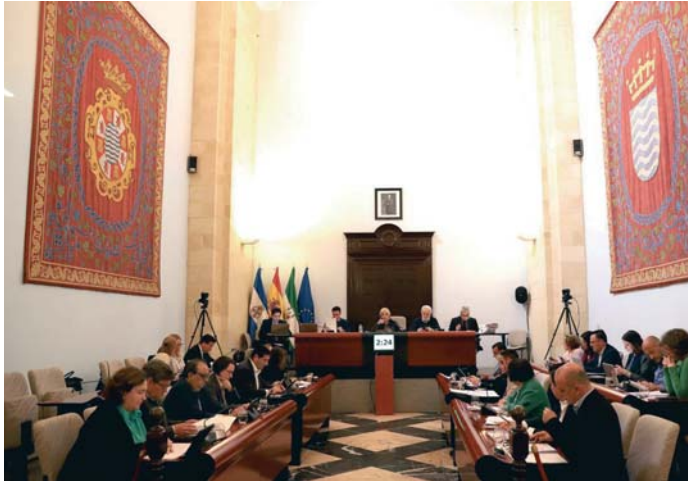
El pleno aprobó la operación de crédito que ha permitido reducir el pago a proveedores. VIVA

Para conseguir esta marca, el Gobierno Local llevó a pleno la aprobación de una operación de préstamo por importe de unos 8,8 millones de