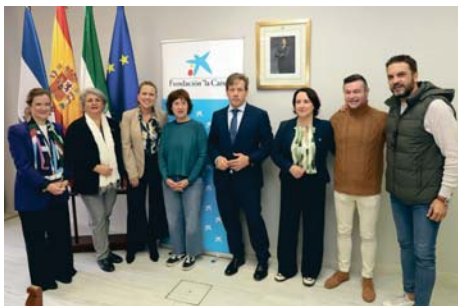
Los representantes de Fundación La Caixa en Jerez.

"Jerez es una ciudad con corazón, este Ayuntamiento tiene corazón, y tenemos instituciones y empresas que tienen mucho corazón, y en este caso le agradecemos a la Fundación La Caixa que cada vez que les llamamos, están ahí".