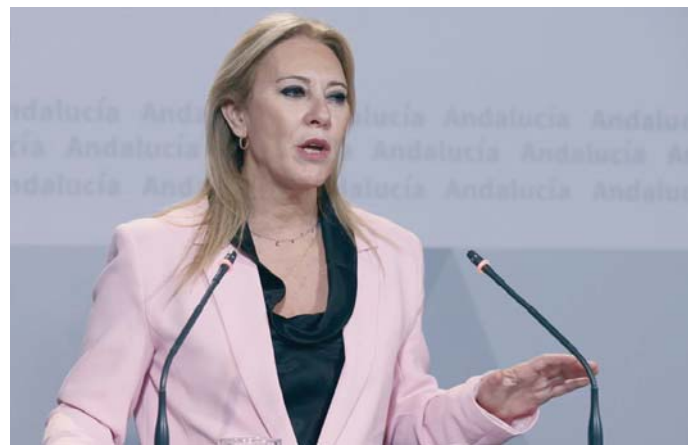
La consejera de consejera de Economía, Hacienda y Fondos Europeos, Carolina España.

Carolina España indicó que el Gobierno andaluz está "en desacuerdo" con la política fiscal que aplica el Ejecutivo de la nación, de la "asfixia fiscal" a la que somete a los ciudadanos, ya que el esfuer-