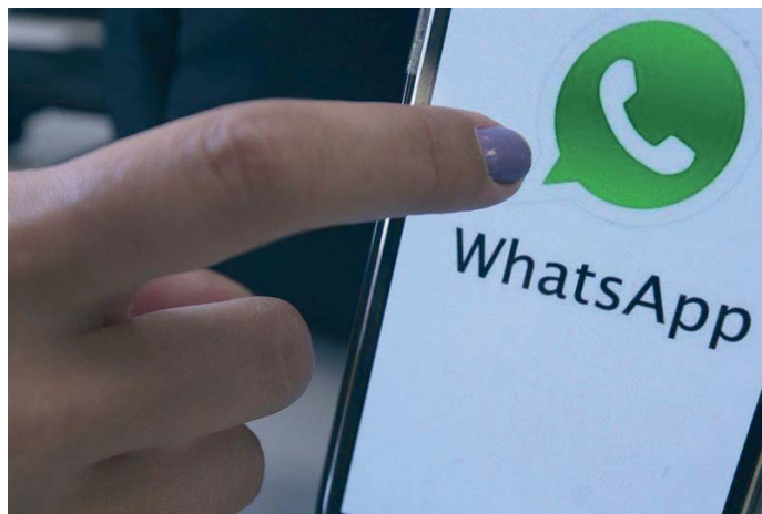
La Policía Nacional ha confirmado numerosas denuncias en la zona por este tipo de estafa. VIVA