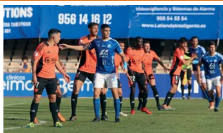
Un lance del encuentro disputado ayer en Chapín. XEREZ DFC

El Xerez DFC rescató un punto ante el Linares en Chapín, empatando el partido en su tramo final (1-1). Por su parte, el Xerez CD cayó en su visita al filial del Almería (1-0) P12-13