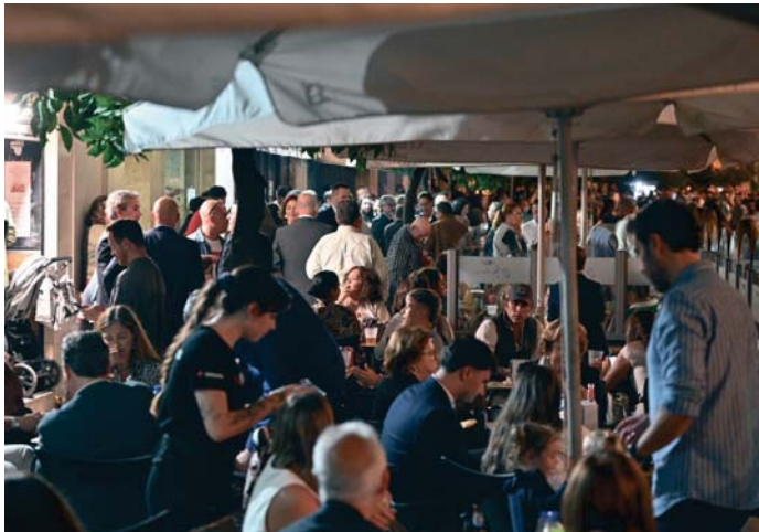
Imagen de una terraza atestada de público en la noche del sábado en el centro.

No hay, de momento, valoraciones oficiales sustentadas en cifras. Será hoy cuando las avance la alcaldesa de Jerez,