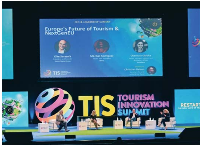
Imagen de la última edición del Tourism Innovation Summit (TIS) celebrada el año pasado.

Durante tres días, esta cumbre del turismo volverá a convertir a Sevilla en el epicentro de la innovación turística a nivel mundial en la que, además de la zona expositiva, habrá un programa de conferencias con más de 400 ponentes para analizar los retos y las tendencias del sector y contará con foros para cada segmento desde el sector de congresos, destinos, hoteles y alojamientos,