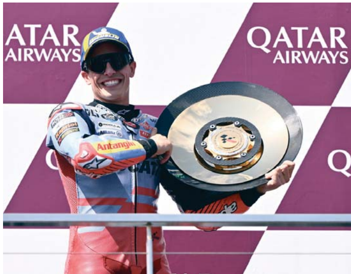
Marc Márquez, del equipo Gresini Racing, celebra su victoria en el Gran Premio de Australia.

A cuatro vueltas del final Marc Márquez vio la oportunidad y superó a Jorge Martín para liderar por primera vez la carrera, pero en la recta