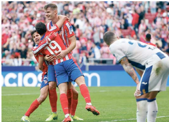
Los jugadores del Atlético de Madrid celebran su victoria tras el encuentro.

En tanto, le costó al Atlético de Madrid reencontrarse con el triunfo después de enlazar dos empates. El Leganés, recién ascendido y metido en una dinámica sin ganar, le planteó numerosos proble-