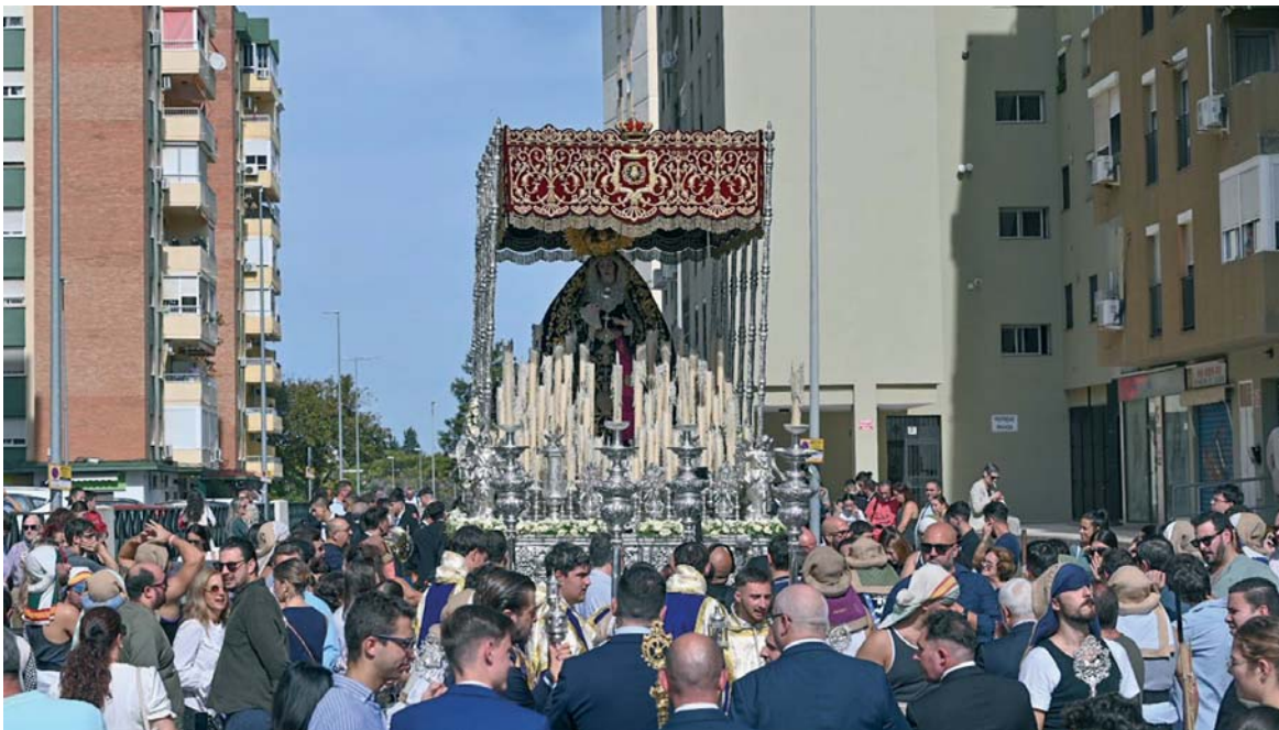
Algunas imágenes regresaron ayer domingo a sus templos, como Angustia de María Santísima, que el sábado se había recogido en la parroquia de San Miguel. VIVA JEREZ

EL GUIÓN PREVISTO El sector destaca la afluencia de clientes y la importancia de celebrar eventos que dinamicen la actividad BALANCE La procesión dejó momentos inolvidables, pero también excesivos retrasos e incluso improvisados cambios en el orden de paso de las cofradías