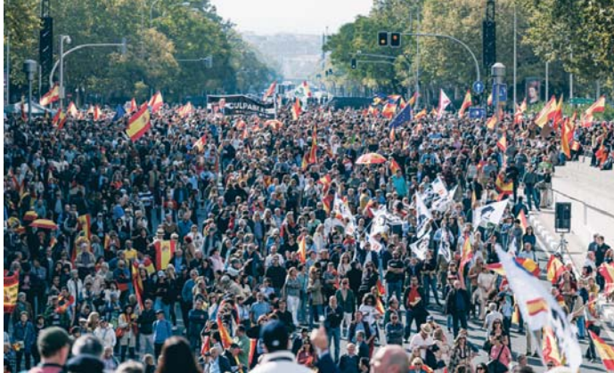
Vista general de la concentración para pedir elecciones en la Plaza de Castilla.

Figuras conocidas como el ex portavoz de economía en el Congreso de los Diputados por Ciudadanos, Marcos de Quintanilla, y el expresidente del PP catalán y cofundador de Vox, Alejo Vidal-Quadras, pronunciaron sus discursos en esta manifestación bajo el lema Por la unidad, la dignidad, la ley y la libertad. ¡Elecciones generales ya! , y advirtieron que si no se reacciona "de ver-