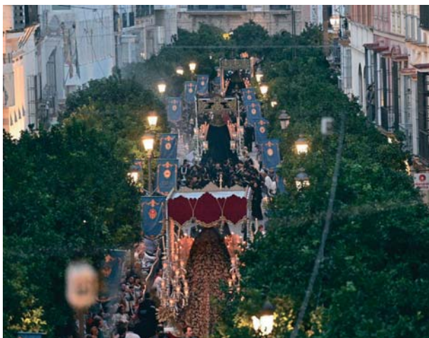
Es indudable que la imagen de la hilera de pasos de palio por el centro de Jerez va a quedar para el recuerdo, más allá de la dificultad de la organización del evento.

La acumulación de retrasos y el hecho de que las cofradías que venían por Letrados debieran esperar a las que accedían desde la zona de Tornería provocó cortes sensibles en la procesión, hasta el punto de que se alteró sobre la marcha el orden inicialmente dispuesto. Esta anómala circunstancia dispuso a muchas de las personas que se encontraban repartidas por la Carrera Oficial, sobre todo a las que habían llegado desde fuera de la ciudad. Desde ese momento, el Consejo empezó a improvisar para dar solución a los problemas que se estaban generando en distintos puntos de los diferentes itinerarios, dado que debe tenerse en cuenta que no existía ningún plan B para un rompecabezas que requería del cumplimiento estricto del orden y los horarios. La imagen que se ofreció desde ese momento no fue en ningún caso la deseada, con consejeros que iban de un lado para otro tratando de garantizar que el engranaje dispuesto no se parase. Sufrieron especialmente esta situación las personas que se encontraban repartidas por la Carrera Oficial, donde el