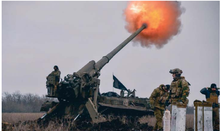
Artillería en manos ucraniana en las proximidades de Bajmut.

Francia se convirtió en el segundo mayor exportador de armas del mundo en 2020-24, suministrando armamento a 65 estados, triplicando la venta a otros países europeos