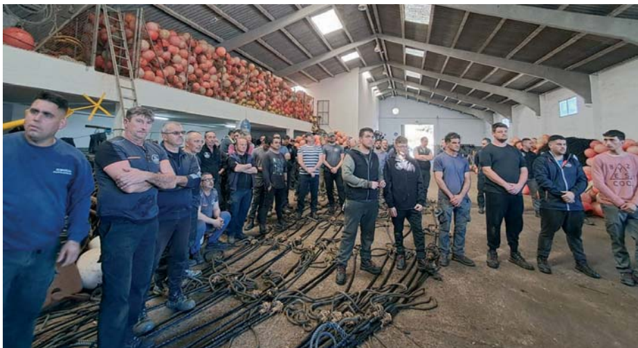
La almadraba celebró en Conil su tradicional ceremonia de bendición de las artes en espera de la llegada de los atunes rojos. AI

Este año una novedad ilumina el horizonte: la almadraba de Sancti Petri, que, tras años en silencio, parece estar a punto de recuperar su actividad, quizás el año que viene. La posibilidad de obte-