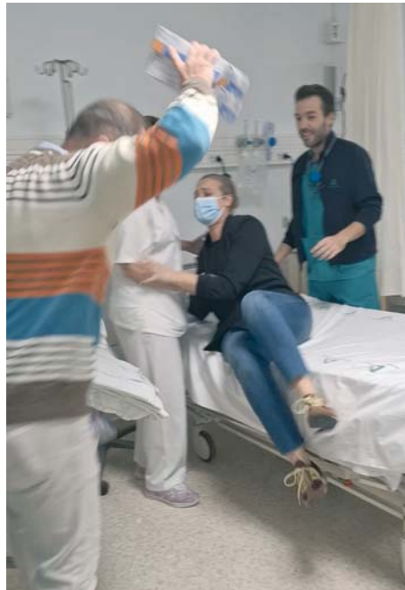
Momento de la recreación de una agresión a personal sanitario.

El primer supuesto se ha desarrollado en una zona común donde se encuentran pacientes encamados recibien-