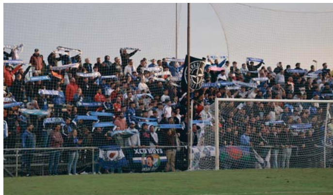
Imagen de la afición xerecista. VIVA

Por su parte, en el apartado de 'Público', el árbitro señala que "en el minuto 96 tuve que detener el partido porque desde el sector de la grada ubicada detrás de la portería derecha conforme sales del túnel de vestuario, donde se encontraban aficionados del Xerez CD identificados por su indumentaria y bufandas del club,