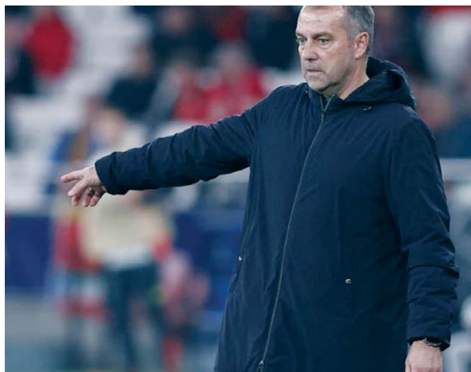
El técnico blaugrana, Hansi Flick, dirige al equipo durante un partido reciente.

Los Blaugranas ya estuvieron en esta ronda la temporada pasada y soñaron incluso con las semifinales tras vencer al PSG en París (2-3). Sin embargo, la expulsión de Ronald Araújo cambió el rumbo de la eliminatoria y los de Luis Enrique avanzaron con un 4-1 en la vuelta. Esta temporada, la situación es diferente. El Barcelona de Hansi Flick se ha mostrado más sólido y ha ajustado sus piezas para competir en todos los torneos. Son líderes en LaLiga, siguen con vida en la Copa del Rey y llegan con ventaja a la vuelta de los octavos de final tras ganar 0-1 en Lisboa.