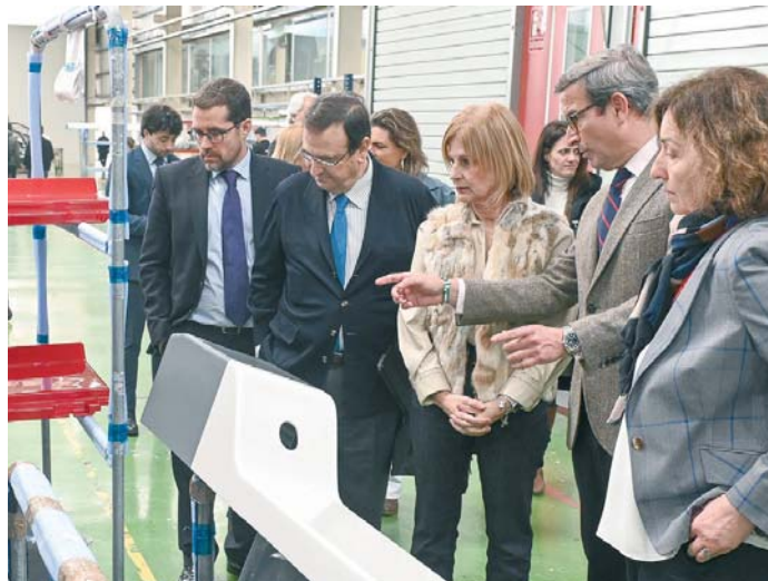
La alcaldesa y el consejero de Industria durante la visita guiada por las instalaciones de Airtificial.