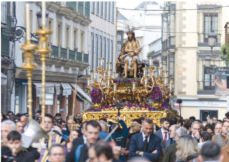
El Señor de la Coronación de Espinas, en el traslado de ida hacia la Catedral para presidir el Vía Crucis de las Hermandades. La imagen fue portada en unas andas compuestas expresamente para la ocasión.