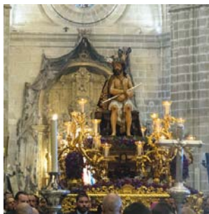
Un momento de la celebración del Vía Crucis, ya en el interior del primer templo. G.C.

El traslado a la Catedral debía iniciarse a las 16.45 horas. Sin embargo, la inestabilidad meteorológica aconsejó una modificación sustancial del itinerario previsto, prescindiendo del recorrido por Ávila, Arboledilla, Medina, Higuera, Angustias, Molineros, Ramón de Cala, Cruz Vieja, Barja, León XIII, Santa Ce-