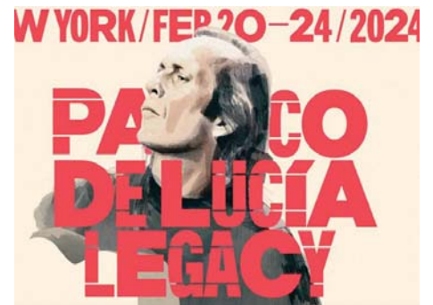
Detalle del cartel promocional de la docuserie. REPRODUCCIÓN

23:50 horas, el canal autonómico retransmitirá El Legado , una producción que transportará a la casa del guitarrista de Algeciras y en la que su hermano Pepe de Lucía, sus hijos Casilda, Lucía y Curro, su primera mujer, Casilda Varela, y su sobrina, Malú, aportarán sus testimonios sobre el célebre guitarrista.