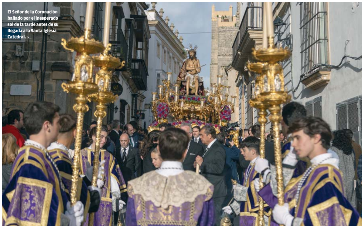
El Señor de la Coronación bañado por el inesperado sol de la tarde antes de su llegada a la Santa Iglesia Catedral. G.C.

CONSEJOS Se pidió a los vecinos próximos a los ríos que pusieran a salvo sus animales y pertenencias