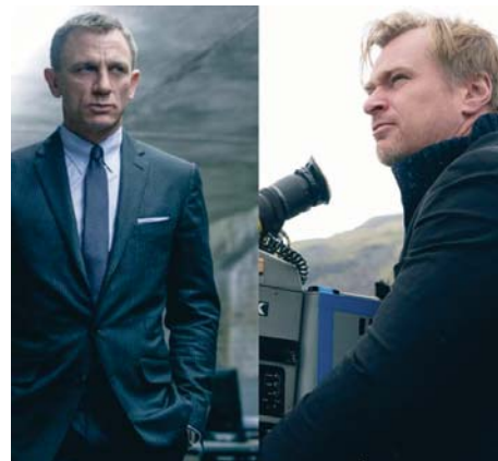
Daniel Craig y Christopher Nolan.