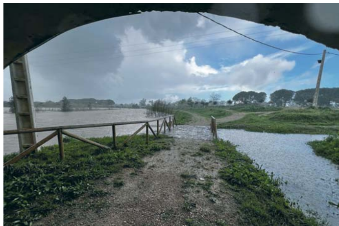
El caudal del Guadalete a su paso por el puente de la Cartuja en la tarde de ayer.

DISPOSITIVO Todo está listo por si hay que llevar a cabo un desalojo en la zona rural