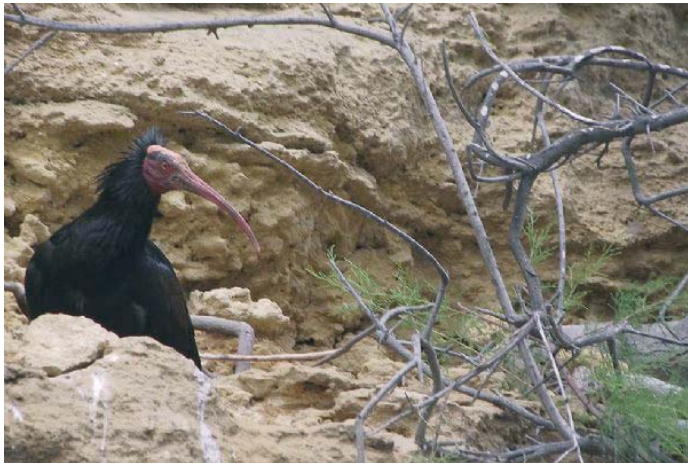
Un ejemplar de ibis eremita en libertad en la provincia de Cádiz.

El teniente de alcaldesa ha tenido palabras de agradecimiento para los miembros de