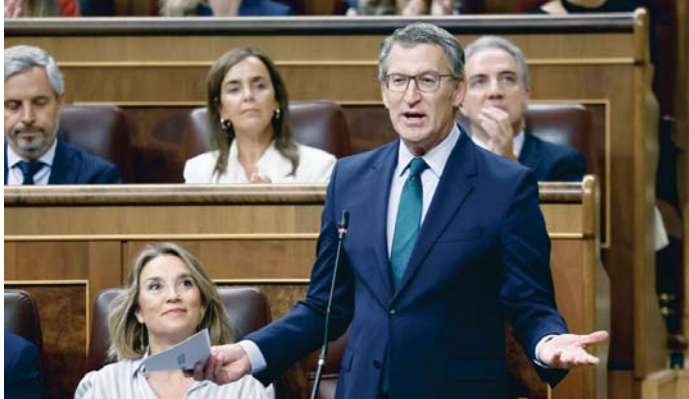
El presidente del PP, Alberto Núñez Feijóo, interviene en la sesión de control al Gobierno.

Feijóo señaló que dicen que Sánchez “es el gran jefe” y dijo que ya empiezan a “saber por qué”, aludiendo a su “ofensiva contra jueces, periodistas y medios de comunicación” en este inicio del curso político. “Lo que usted llama regeneración democrática realmente es un plan de censura. Ha pasado de tener problemas con la verdad a tener problemas con los que la cuentan”, enfatizó. “Mientras usted persigue a los periodistas, yo propongo