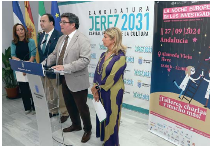
Un momento de la presentación de esta jornada, que dará comienzo a las 18.00 horas del sábado. VIVA JEREZ

De esta forma, los visitantes podrán conocer en primera persona las investigaciones sobre temas de todas las áreas de conocimiento, a través de 55 talleres centrados en lingüística forense, contaminación lumínica, astronomía, el mundo nano, impresión 3D, realidad virtual, reanimación cardiaca, diabetes tipo 2, ciberseguridad, arqueología, matemáticas aplicadas a la medicina, plantas medicinales, robótica, gestión de cos-