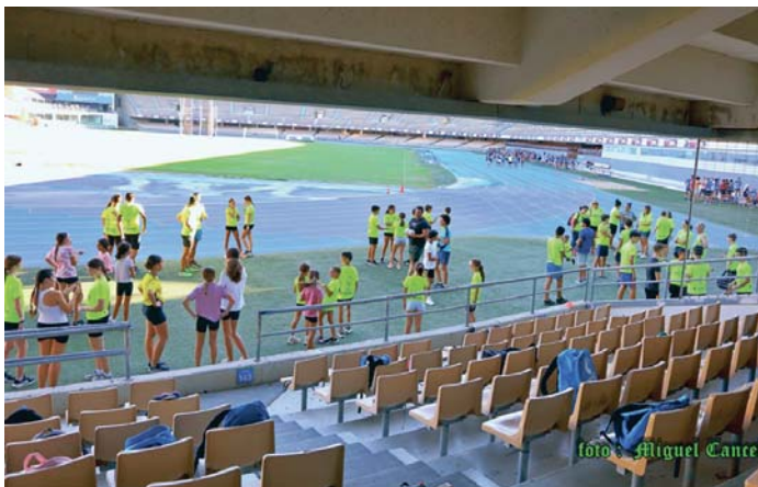
Integrantes del Atletismo Ciudad de Jerez Runchip en la pista del Municipal de Chapín.