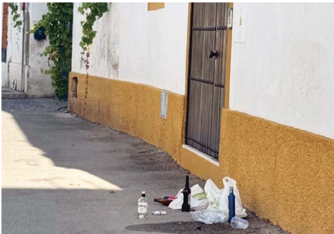
Algunos de los restos recogidos por los vecinos este pasado fin de semana en la calle Don Juan. VIVA JEREZ

"Es vergonzoso que tengamos que salir cada mañana a limpiar los portales de nuestras casas. Han llegado a orinarse en las puertas", añaden, en lo que no deja de ser una muestra más de la "degradación" que está sufriendo el barrio. Los efectos de este tipo de concentraciones llegan a la cercana calle Don Juan, donde este pasado fin