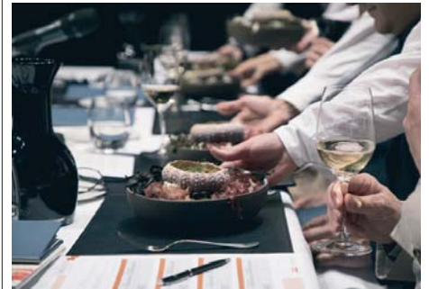
Final de la pasada edición de la Copa Jerez.

Los finalistas, seleccionados por un jurado de expertos entre las numerosas propues-