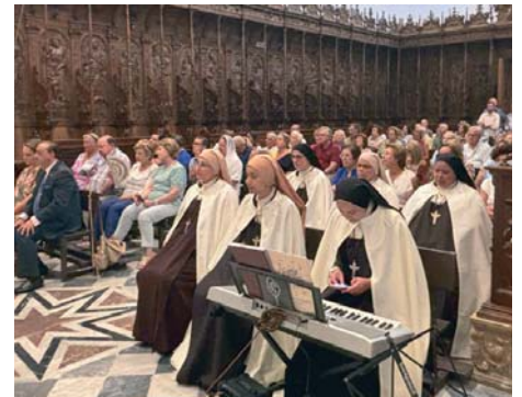
Un momento de la ceremonia de acogida a las hermanas Carmelitas.

Por último, cabe mencionar que las cuatro hermanas que estarán habitando el Monasterio estuvieron acompañadas ayer de otras que proceden de otra fundación en nuestro país.