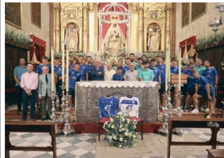
Ofrenda del Xerez DFC a la Virgen de la Merced.

La petición que se hace a la Merced es "salud, que no haya lesiones en la cantera y en el primer equipo".