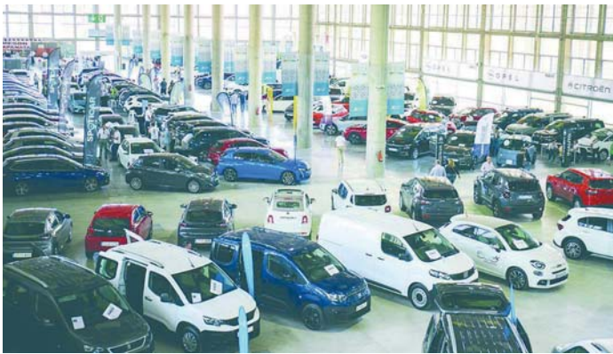
Imagen del salón del motor celebrado el pasado otoño en las instalaciones de Ifeca. VIVA