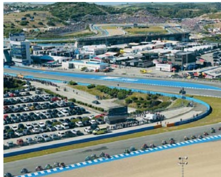
El Circuito de Jerez, durante el Gran Premio de España. A.I.

con la Promoción Fidelidad, a la que siguió durante el mes de diciembre, la Promoción de Navidad que abarcó hasta el pasado 7 de enero. Durante estos 49 días desde el inicio de la venta de entradas, se han venido un total de 13.920 entradas más que las vendidas por estas mismas fechas en 2024, lo que supone un incremento del 50%. Se inclu-