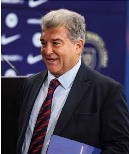
El presidente del Barcelona, Joan Laporta, en rueda de prensa.

“Nosotros presentamos la documentación en LaLiga el 27 de diciembre, la enviamos dentro del plazo, lo que pasa es que durante el 28, 29, 30 y 31 nos pidió que la completáramos. Pensábamos que ya teníamos el 1:1, pero LaLiga nos pidió unos requisitos adicionales que no estaban incluidos en la normativa, según nuestra opinión y no nos lo dio”, explicó Laporta en rueda de prensa. Por ello, solicitaron la extensión de la licencia de los dos futbolistas a la RFEF, que les dijo que “no había ningún inconveniente” en tramitarla, aunque les comunicó que no estaban en el 1:1. “LaLiga y la RFEF nos dijeron que se aplicaba un artículo que estaba obsoleto, cuya finalidad es la estabilidad de la competición y pensamos que no entrábamos en ese supuesto, hecho para evitar que jugadores y clubes se inscribieran en varias ocasiones en una