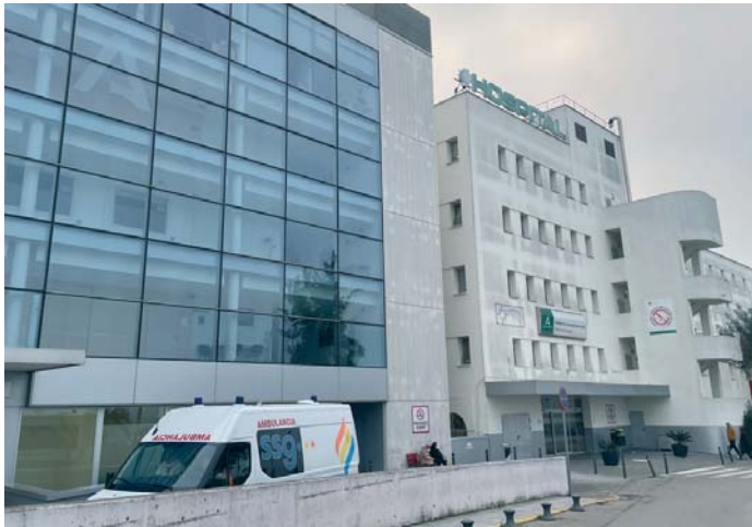
Imagen del acceso al Hospital de Jerez, donde ya se está notando la sobrecarga por casos de gripe.

En el caso de la atención primaria la sobrecarga, dice, es “crónica, ya que no se cu-