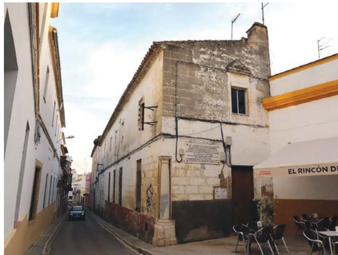
Una imagen del exterior de la finca, donde aparece una placa de homenaje a Antonio Chacón.

Por otra parte, la Junta de Gobierno local ya ha adjudicado a la empresa Séptima Reformas y Gestión de Edificios S.L. la finca de la calle Juan de Torres 12 que fue igualmente sometida a un procedimiento