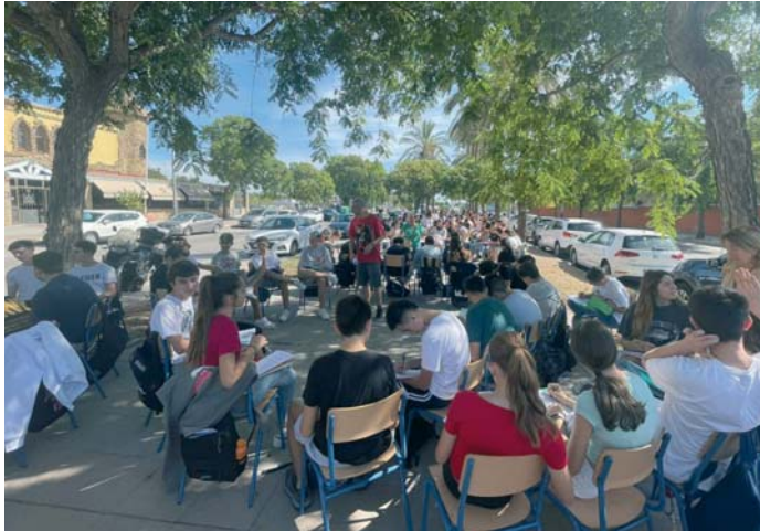
Los alumnos dando clases en la calle, frente al centro, en una protesta del pasado octubre. JIMÉNEZ

Es por ello por lo que esta formación política llevará esta situación el día 6 de febrero al Parlamento Andaluz. Según García, “la consejera de Educación estará obligada a dar explicaciones a la ciudadanía sobre la falta de actuali-