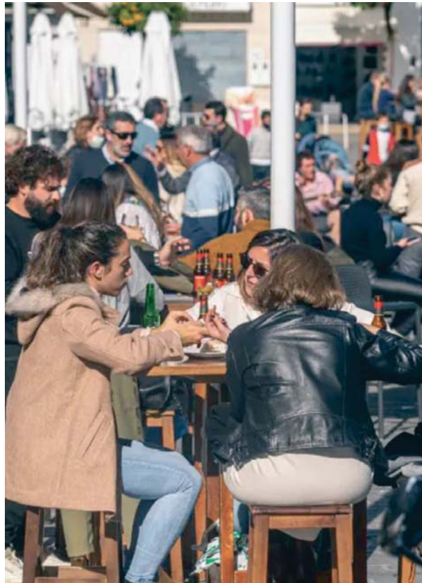
Grupos de personas disfrutan del buen tiempo en una terraza de Sevilla.

El sector también es un motor de empleo, ya que la gastronomía contribuye a generar y mantener un total de 7,2 millones de puestos de trabajo de forma directa e inducida