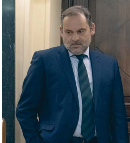
El exministro de Transportes José Luis Ábalos.

Una vez aprobado el dictamen favorable a levantar el fuero, el siguiente paso será